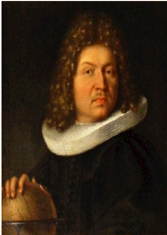
(a) Jacob Bernoulli

Formule za sume m -tih potencija u generaliziranom obliku je prvi dao Thomas Harriot (1560. – 1621.). U otprilike isto vrijeme, Johann Faulhaber (1580. – 1635.) je dao formule za sume do 17. potencije, što je bilo puno više od ikoga prije njega, ali nije znao kako ih poopćiti. Često se smatra da je Pierre de Fermat (1601. – 1665.) zaslužan za otkriće formula, ali ipak je Blaise Pascal (1623. – 1662.) bio taj koji je dao eksplicitne formule. Jacob Bernoulli je najpoznatiji i najzaslužniji za prezentiranje formula za sume m -tih potencija europskoj matematičkoj zajednici. Njegova formulacija je najkorisnija jer je generalizirao formule i dao precizne upute za pronalaženje koeficijenata u formulama [?, 6]